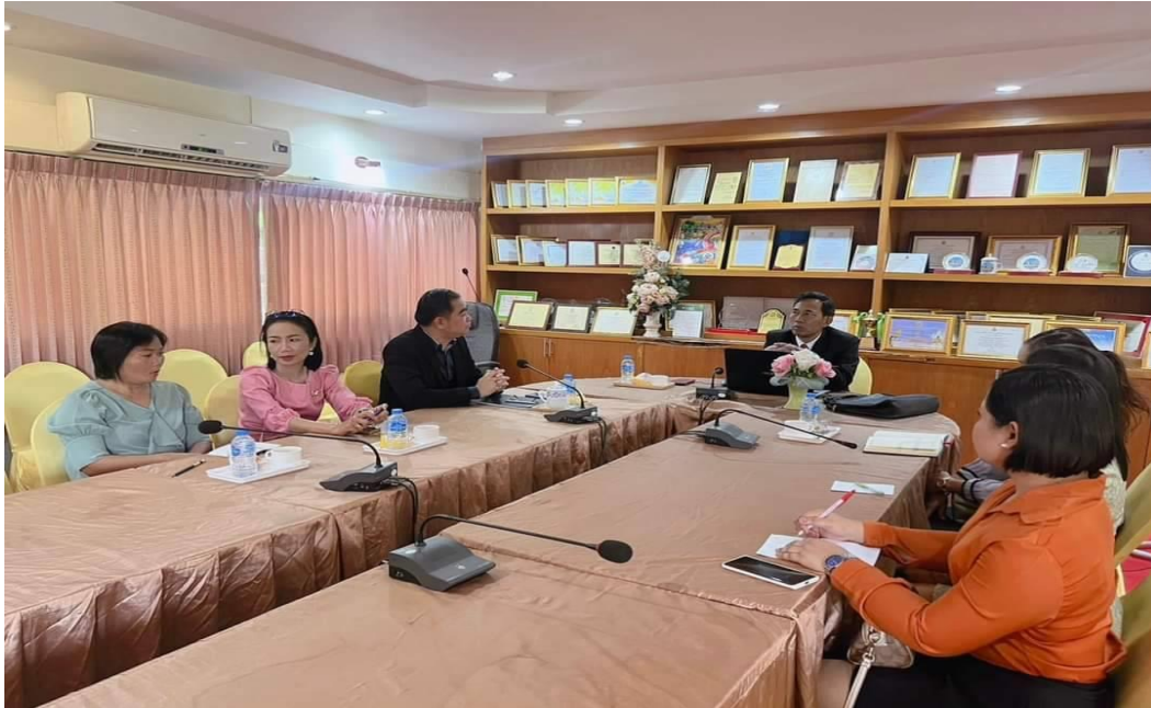
ภาพกิจกรรมการศึกษาดูงาน โรงเรียนบ้านห่ม (ห่มประชานุเคราะห์)