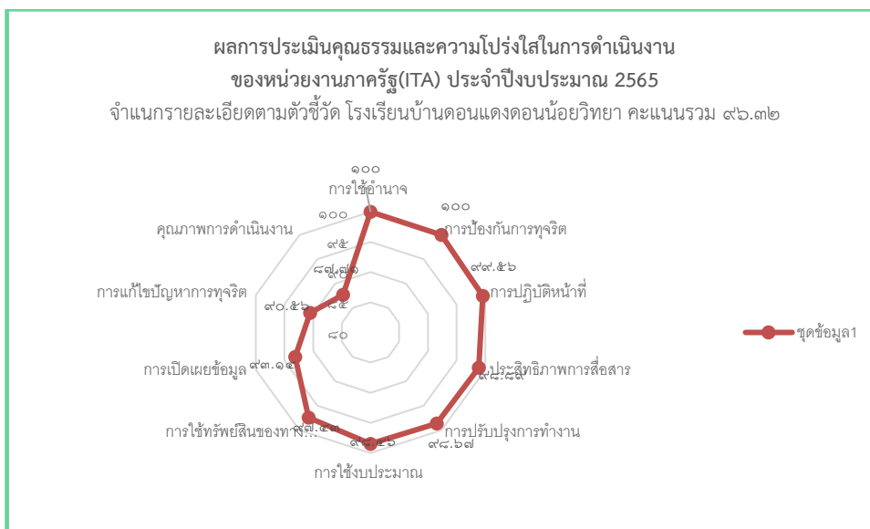
แผนภาพที่ ๒ ผลการประเมินจำแนกรายละเอียดตามตัวชี้วัด